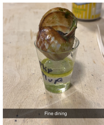
(Snergina i fråga)